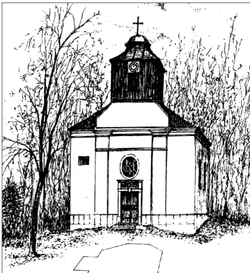
Homole - kostel sv. Pia V.

a další (před kostelem je na návrší na balvanu umístěna pamětní deska). Homolský potok poháněl v minulosti řadu mlýnů, ze kterých zůstaly v okolí jen místní názvy. Od roku 1850 byla osadou obec Doubravice, od r. 1961 byla samostatnou obcí.