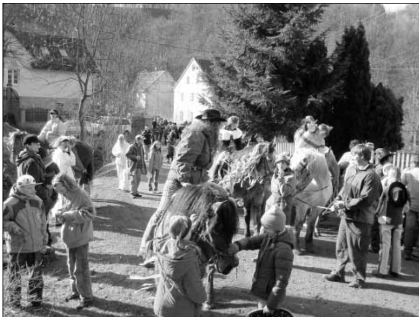
V průvodu se všichni dobře bavili.

Hlavní masopustní zábava začínala o „masopustní neděli“ bohatým obědem a hodováním. Nezbytnou součástí masopustního jídelníčku byly koblihy smažené na másle. Na stole ovšem nemohly chybět ani boží milosti, klobásy a slanina a pochopitelně pálenka, neboť tím vším byli obchůzkáři obdáváni. A pokud byla na Masopust třeskutá zima, vhod přišlo i počastování te-