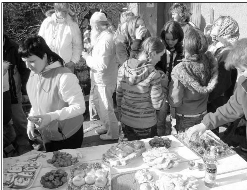
Nechybělo ani bohaté pohoštění.

plou zhrívanicí. V pondělí pak probíhaly různé taneční zábavy a v úterý sváteční průvody maškar, hrálo se divadlo a podobně. Odbytím nebo lépe řečeno odtrobením půlnoci však veškerá zábava končila. Začínala popeleční středa a s ní i předvelikonoční postní období. Lidé věřili, že pokud budou o Masopustu tancovat přes půlnoc, objeví se mezi nimi ďábel, často jako cizinec v zeleném kabátě.