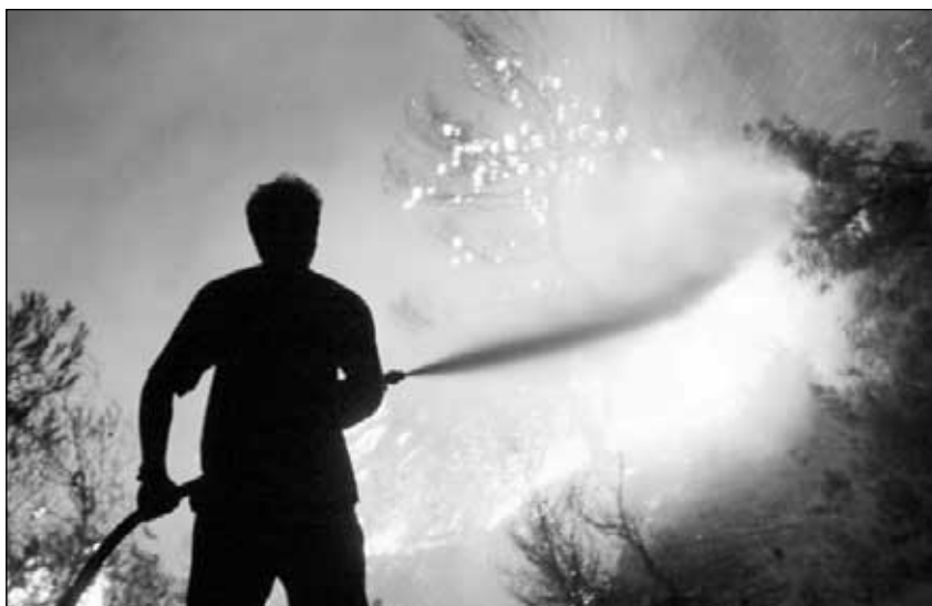
Vypalování trávy mnohdy zapříčiní rozsáhlé požáry.

netýká pouze živočichů, ale také rostlinných společenstev a půdních mikroorganismů. Výsledkem bývá snížení druhové rozmanitosti společenstev rostlin, živočichů a mikroorganismů.