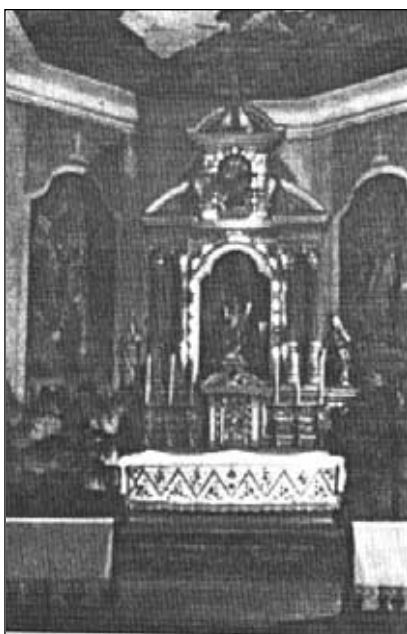
Homole - oltář kostela, 1962