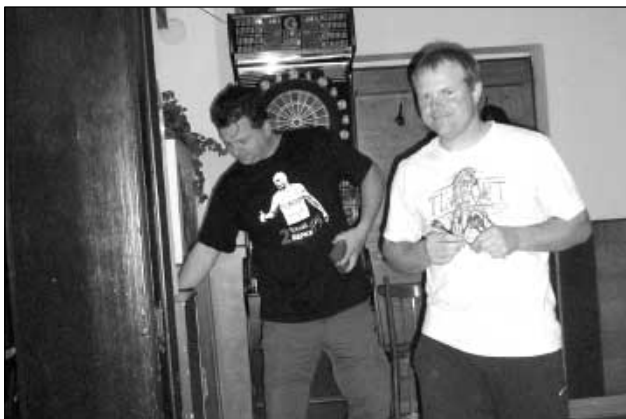
Kdo z nich vyhraje...