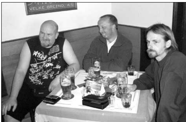
Pro vynikající výsledek musí být dobrá příprava

Už po několikáté se každým rokem koná velikonoční turnaj v šípkách v hostinci u Horáčků. Letos to bylo v sobotu 23. dubna 2011 od 14:00 hodin.