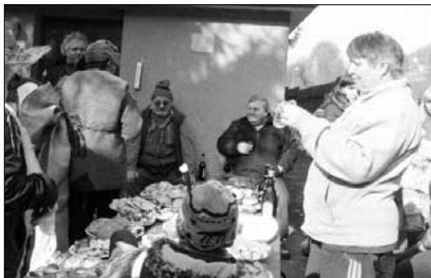
U Vegnerů v Byňově

Další návštěva se konala na kopečku Byňova, u Antošů a (Pokračování na následující straně)