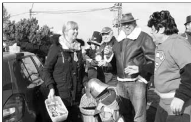
U Horů v Nové Vsi u Pláně