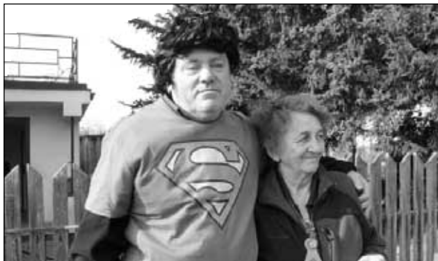
U Moravců ve Lhotě pod Pannou