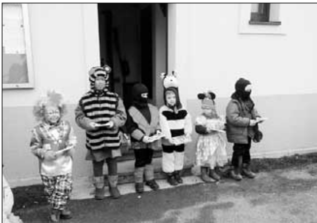
Děti s vítěznými maskami