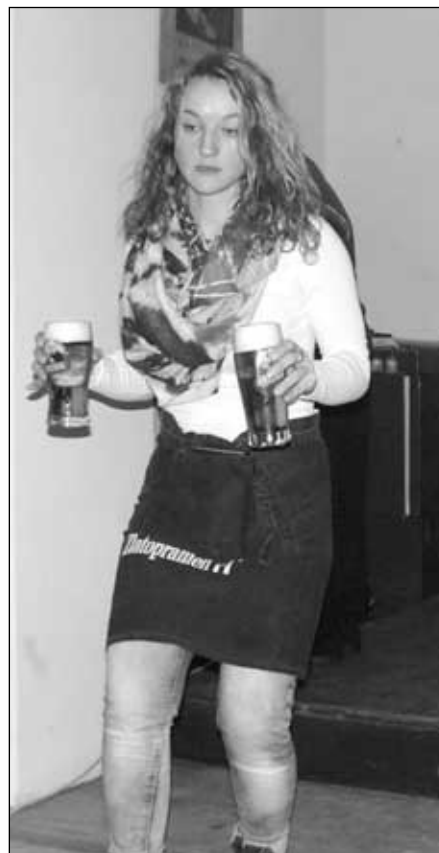
Naše nová hostinská