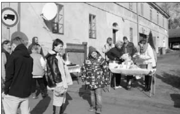
U Hastrdlů v Suleticích