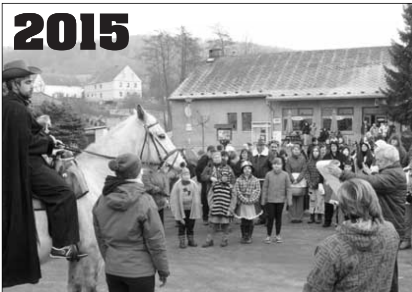
Povolení k reji