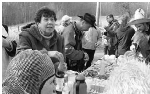
Chalupáři ze Suletické stráně