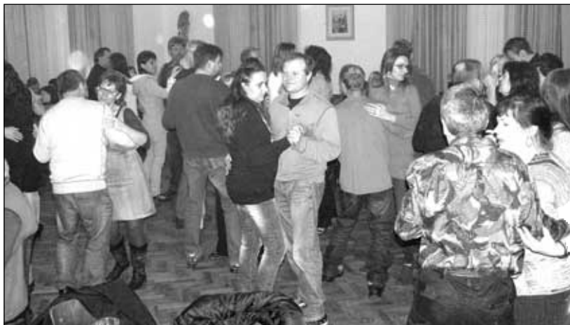
Taneční parket jen duněl

Věřím, že se každý pěkně pobavil a těší se opět na příští tancovačku. E.S.