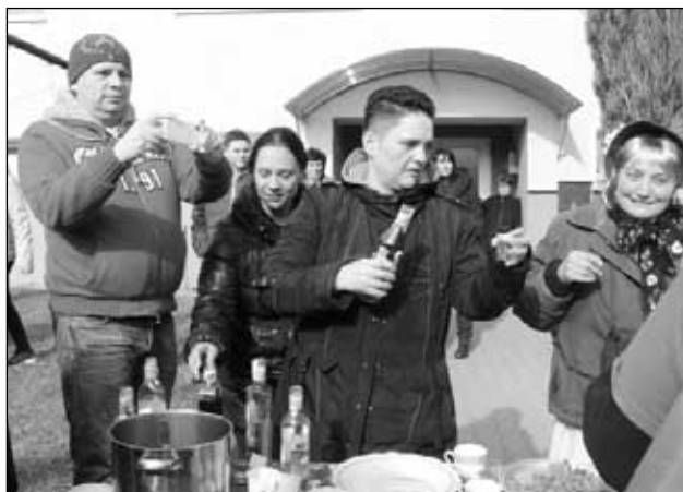
U Barboříků ve Lhotě pod Pannou