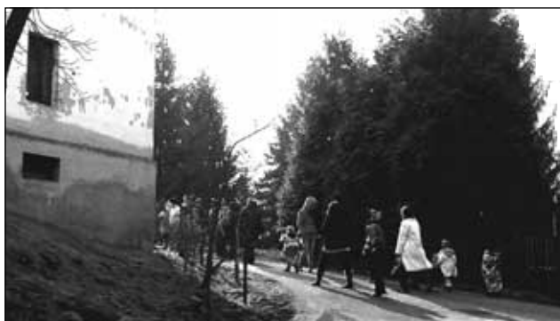
U Antošů v Byňově