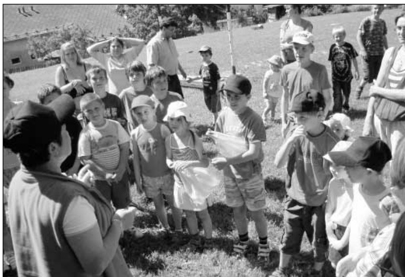
Zahájení dětského dne.