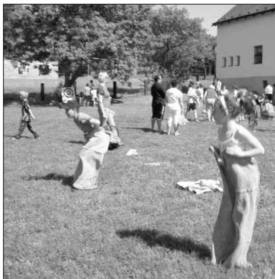
Skákání v pytlí.