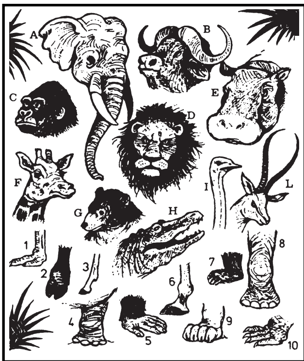
Poznáte která tlapa patří k hlavě zvířete?

● Říká Skot Mac How svému bratrovi, když se jim podařilo přelést plot fotbalového hřiště: „A ne, abys dneska házel lahvevi po rozhodčím. Všechny jsou zálohované!“