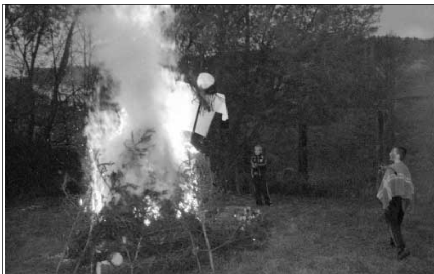
Čarodějnice v plamenech.