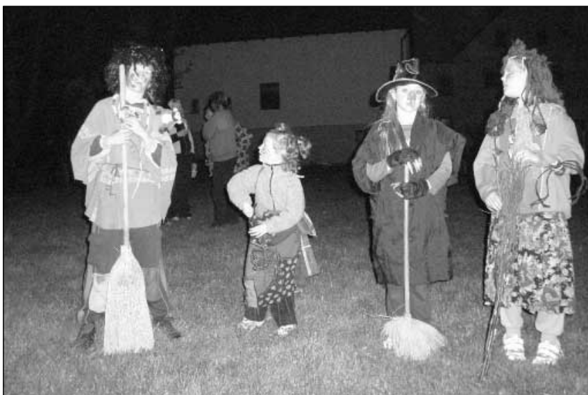
Nejlepší masky čarodějnic.