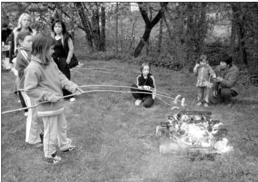
Děti při opékání špekáčků.