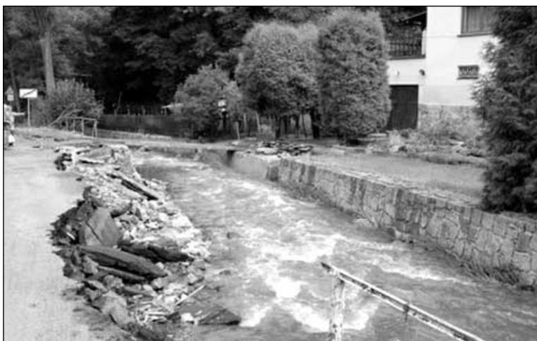
Vodou vymletá silnice v Byříně