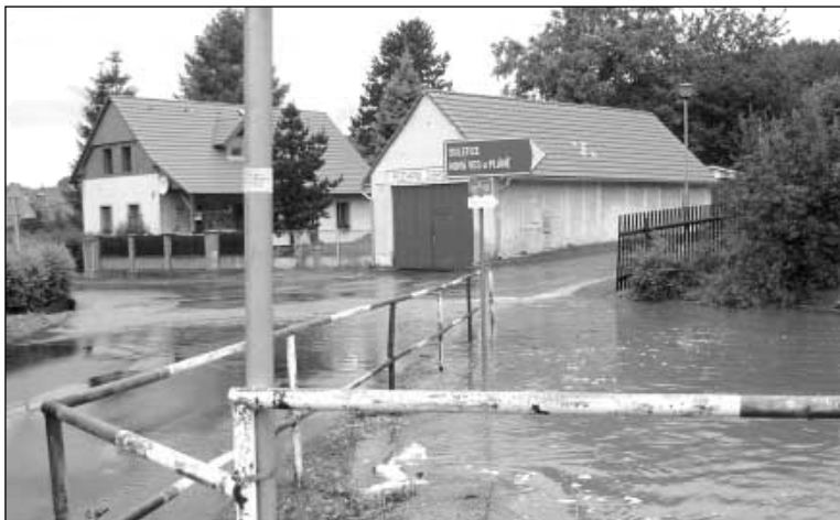
Rozlitý rybník v Homolí

Z důvodu neustálého pršení se zvedly na Homolsku hladiny potoků. Kde bývaly jen suché strouhy tekly proudy vody. Začalo to 9.8. v sobotu. Bohužel se voda nezastavila ani před zahrádkami ani dvory domů. Po velké vodě zůstaly poničené silnice a mosty.