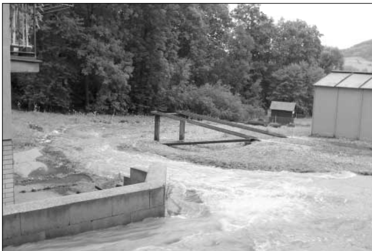
Voda se valila okolo bytovky 43