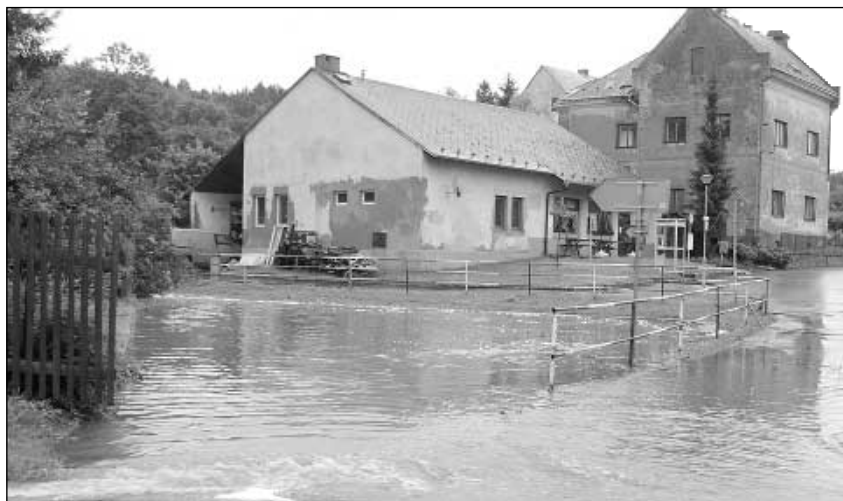
I naše vesnice patří mezi ty nešťastné obce, které postihla velká voda.

■ V měsíci září byla činnost OÚ již zaměřována na organizační a technické zabezpečení komunálních voleb.