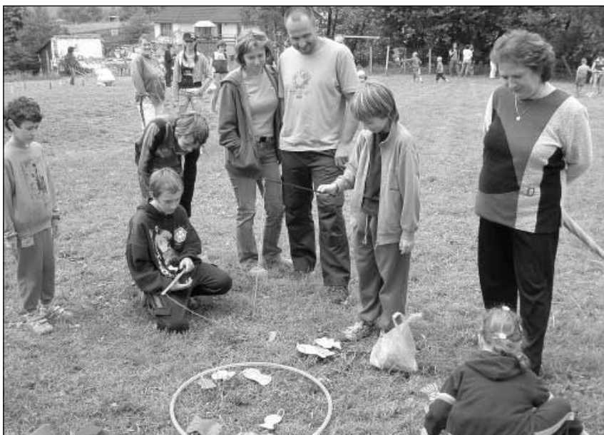
Děti při chytání rybiček.