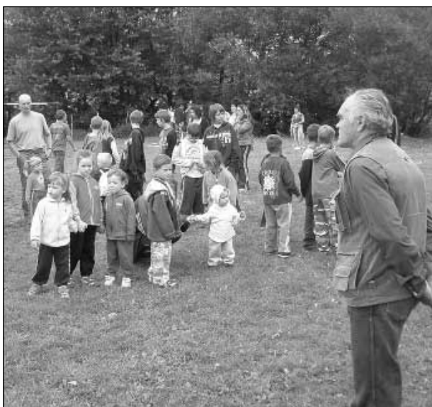
Předsaeda KV vítá děti.