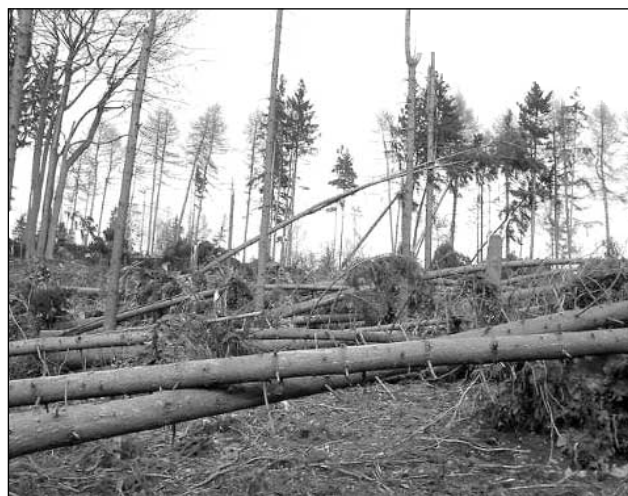
Co všechno dokáže vítr poničit.