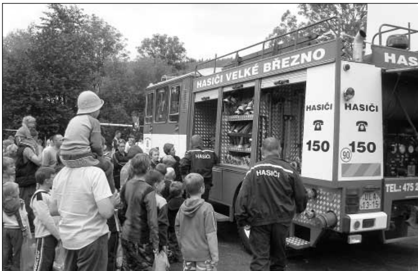
...á přijeli velkobřezenský hasiči.