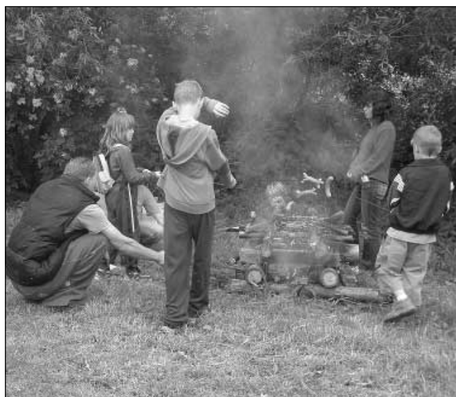
Všichni se těšili na opékání vuřtů.