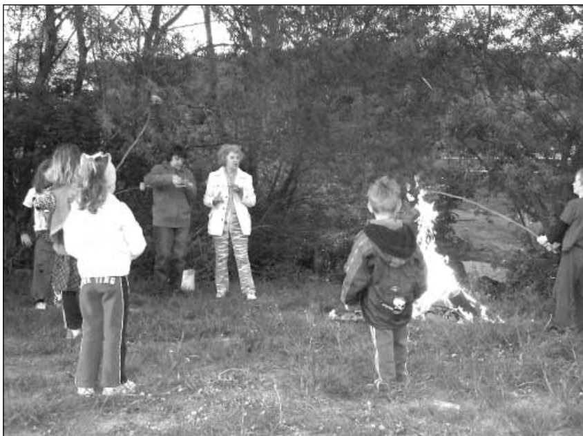
Opékání vuřtíků bylo slastným završením pálení čarodějnic.