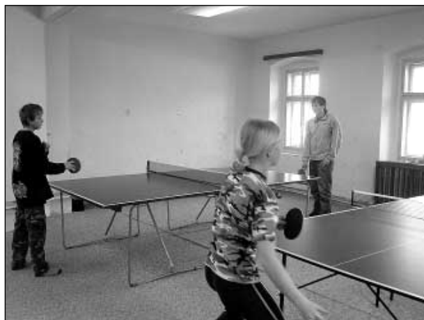
Všichni hráči bojovali s velkou vervou.

V pátek, 16. března od 14.00 hodin se konal turnaj ve stolním tenise v místní herně.