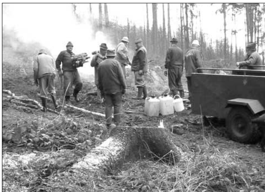
Myslivecké sdružení „Hubert“ a „Lesní roh“. Na brigádě úklidu lesa po orkánu „Kyrill“ na úseku „Fráze“, kde spadlo 130 m 3 dřevní hmoty.