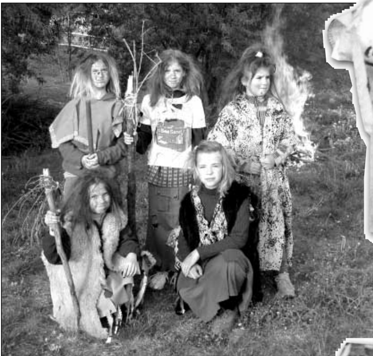
Slet čarodějnic se vydařil.

H ranici postavili veřejně prospěšní pracovníci. Dřevo na oheň dodala obec Homole z obecních lesů. Kolem sedmé hodiny se pomalu začali scházet děti i dospělí na hřiště v Homoli. Děti měly možnost opéci si špekáček nebo liberecký párek. K tomu dostaly tácek s hořčicí nebo s kečupem, podle toho co mají nejradši a kousek chleba. Na zapití dostaly pitíčko. Pro dospělé se čepovalo pivo z hostince U Horáčků. Také se vyhlášovala ta nejkrásnější čarodějnice - celkem se jich dostavilo pět a přiletěly všichni na koštěti, jak to má být. Každá z nich dostala nějakou sladkost, kterou opět věnoval pan Krombolcz, tímto mu moc děkujeme.