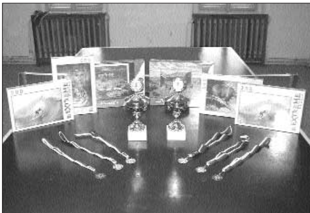
Na výherce čekaly tyto pěkné ceny.

V sobotu 17. prosince se konal jako každý rok turnaj v šipkách pro děti v místní hemě. Děti dostaly sušenku a pitíčko, aby se posílily než budou hrát. Když se soutěžící rozdělili na dvě kategorie, mladší do 12ti let a starší do 15ti let. V hemě zavládla soutěživá nálada a každý si chtěl vyhrát pohár, který byl letos obzvlášť velký a krásný. Všem umístěným vítězům byla věnována věčná cena puzzle se zvířecími motivy a surfaře na vlně. Obdarována byla čtvrtá i pátá místa v po-