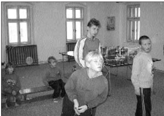
Úspěch při házení šipek - to je maximální soustředění.