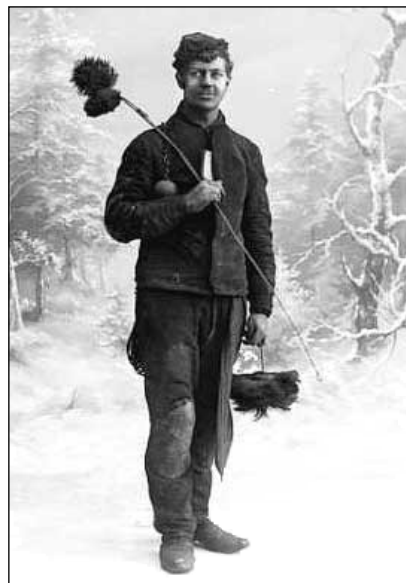
I v dávných dobách byl kominík nepostradatelným pro každou vesnici.

Před připojením nového spotřebiče a při jeho změně je požadován doklad o revizi komína. Následující údaje nezačínají průmyslové objekty a byty vytápěné z centrálních zdrojů tepla nebo kotelny. Rozdělení vytápění domů dle použitého paliva: cca 60 % pevná paliva, 23 % plyn nebo LTO, 14 % pevná + plyn nebo elektrické vytápění, pouze 3 % elektrické nebo jiné bez spalin do ovzduší v našem okolí.