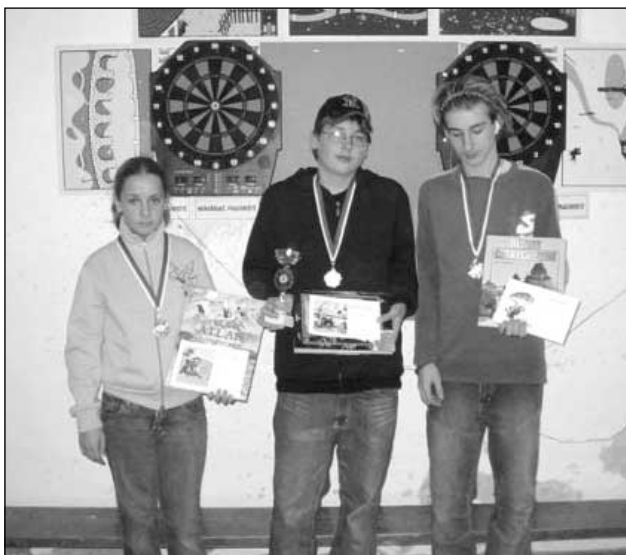
Vítězové ze starších dětí.