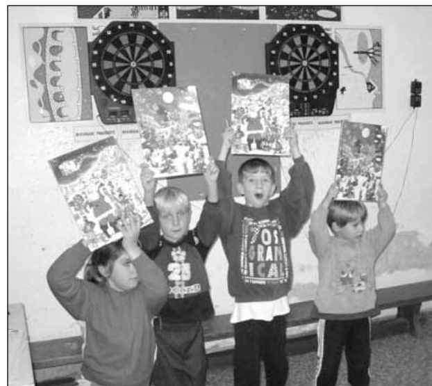
Ti, kteří se neumístili ale stejně si něco odnesli.