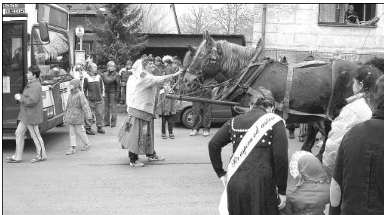
Dorazil povoz s koňmi a může se vyrazit.