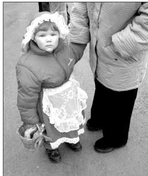
Přišla i malá Karkulka s malým košíčkem, co v něm asi má?