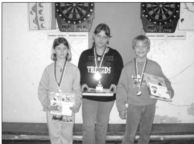
Vítězové v mladší kategorii.