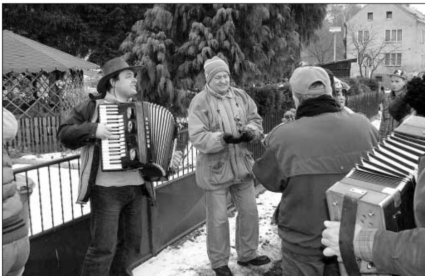
Celou cestu muzikanti hráli a zpívali.