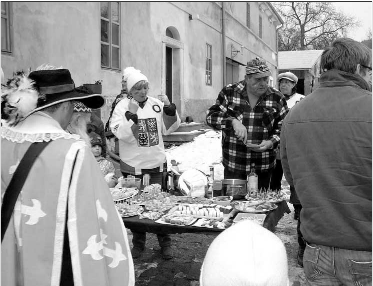
Zastavení na občerstvení v Suleticích u Hastrdlových. Další foto z masopustu najdete na následující straně.

17. ROČNÍK • 1. ČTVRTLETÍ 2009 • VÝTISK PRO OBČANY OBCE ZDARMA