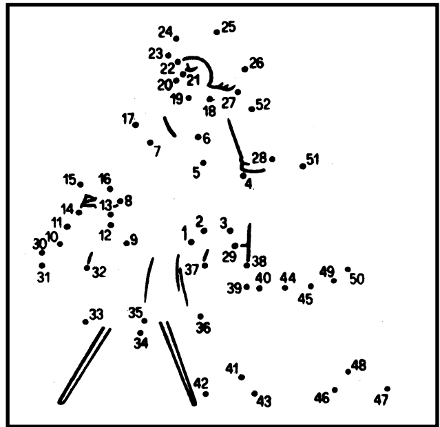
Postupně spojte všechny body podle čísel.