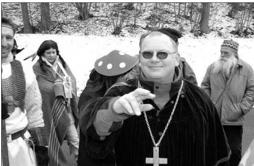
Některé masky byly opravdu originální.