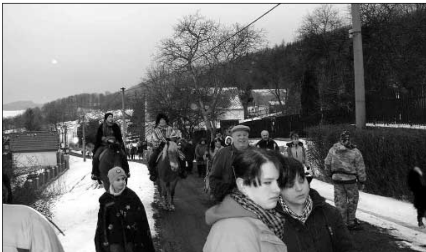
Masopustní průvod v Nové Vsi.