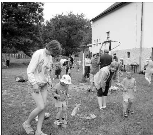
Chození na špalíkách.