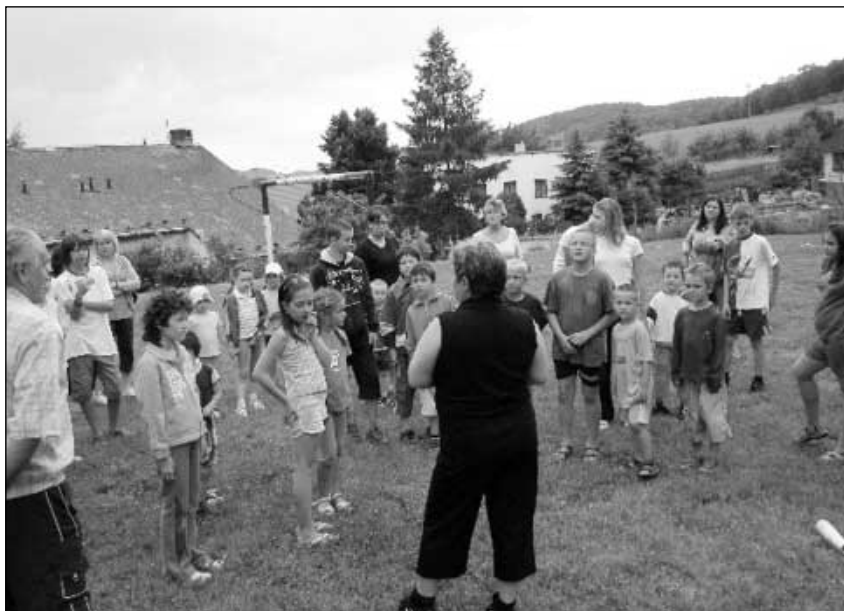
Přivítání dětí na dětském dni.

V sobotu 7. června se konal na hřišti v Homoli dětský den. Začalo se po druhé hodině. Před půl druhou se obloha zatáhla a začaly hromy a pár blesků. Naštěstí se počasí umoudřilo. Děti se mohly zdokonalit v házení šipek, chytání rybiček, chození po špalíkách, shazování kuželek a jiné disciplíny. Také přijeli hasiči z Velkého Března a přítomní si mohli prohlédnout hasičské auto pěkně zblízka, sednout si za volant nebo vyzkoušet helmu. Nakonec si všichni opekli špekáčky na ohýnku, dostali k tomu kečup nebo hořčici. Ještě předtím děti dostaly nanuk. Dětský den se vydařil jak počasím tak účastí. Nezbyvá než poděkovat myslivcům za poskytnutí prostoru v myslivně a také moc díky všem lidičkám, kteří pomáhali. Zdeňka Černá , redaktorka