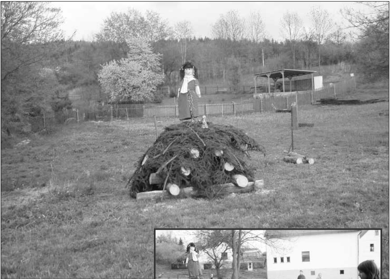
▲ Čarodějnice na vatře.