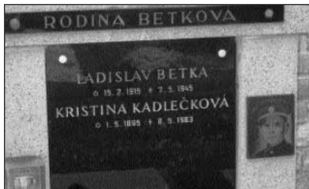
Hrob Ladislava Betky je umístěn na hřbitově v Praze 9 - Hrdlořezy.

Další životní kroky Ladislava Betky směřovaly do Prahy do služeb Pražské státní policie. V době Květnového povstání českého lidu v roce 1945 se tento velkobřezenský vlastenec objevuje na barikádách na praž-