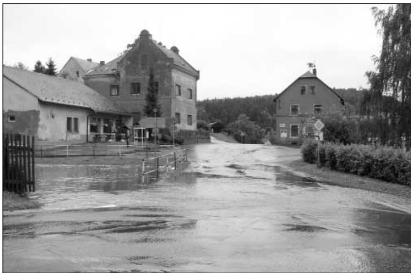
Loňské léto nás překvapilo - přišel velký déšť a zanechal za sebou velké škody na našich majetcích.