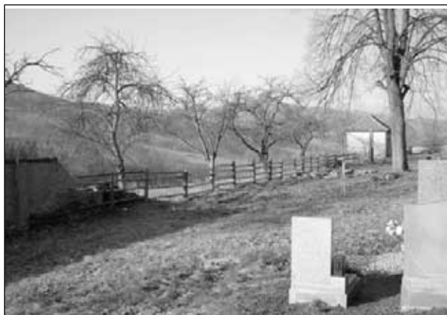
Hřbitovní zeď před opravou.