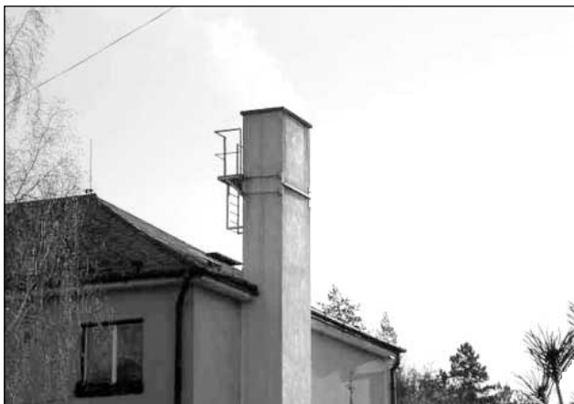
Komín na bytovce 47 po provedné rekonstrukci.