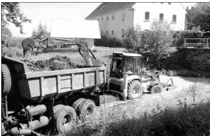
Odvoz nánosů z rybníčku v Doubravicích.