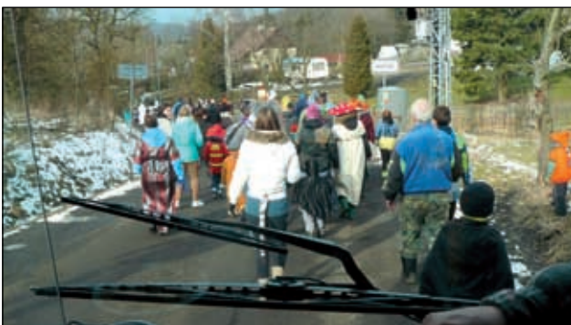
Příchod do Suletic.