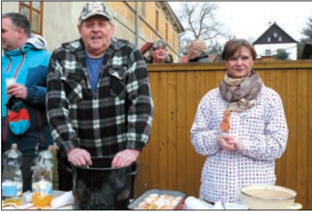
U Hastrdlů v Suleticích.