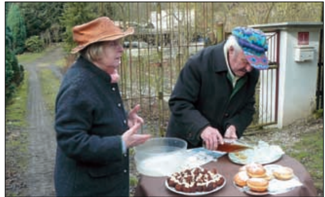
U Löbelů v Byřově.