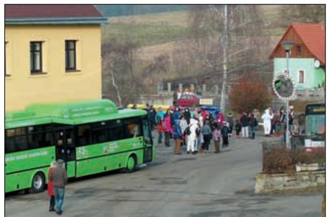
Sraz na Homolské návsi.