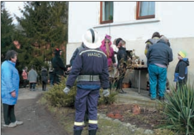
U Antošů v Byřově.