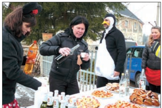
U Vaněčků v Haslicích.