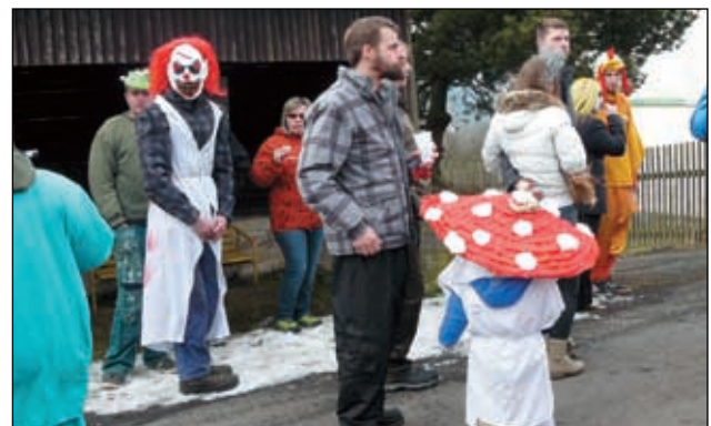
U Horů v Nové Vsi u Pláně.