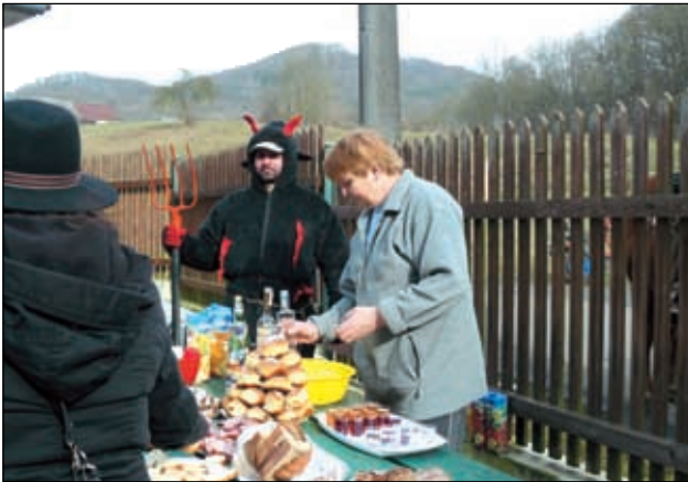
U Vegnerů v Byřově.