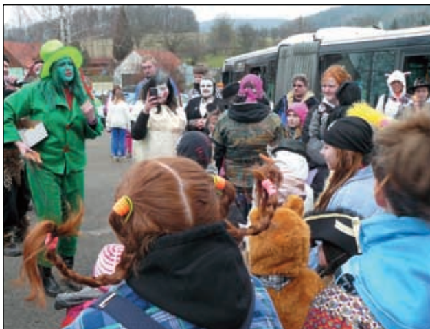
Odněna pro děti v maskách na Homolské návsi.