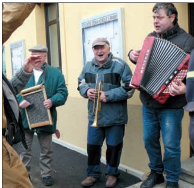
Tato kapela doprovázela po celý průvod.