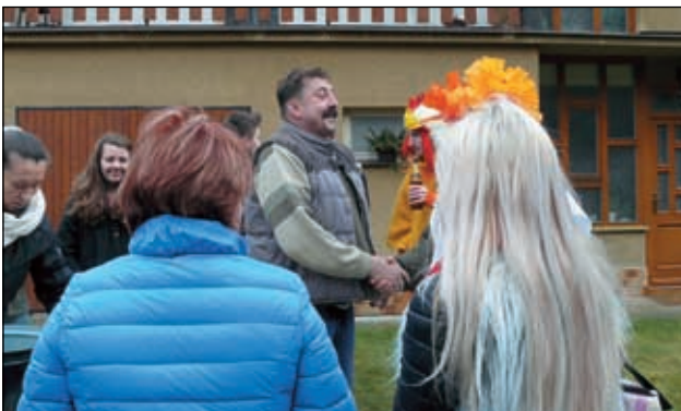
U Beránků v Byřově.