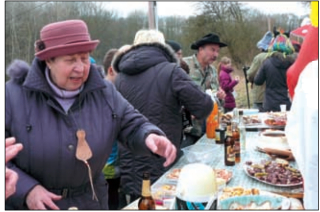
Chalupáři ze Suletické stráně.