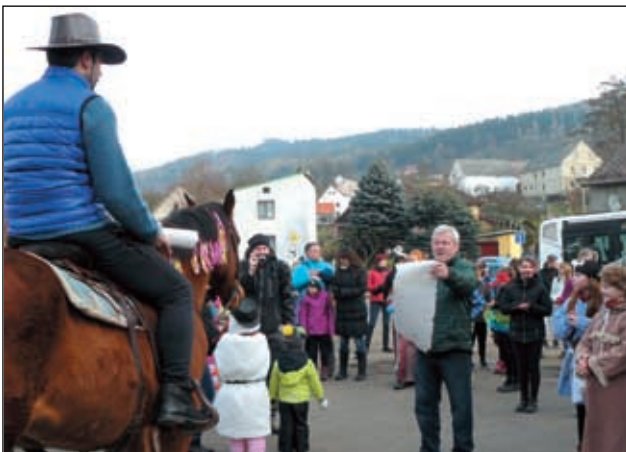
Starosta povolil Masopustní rej.