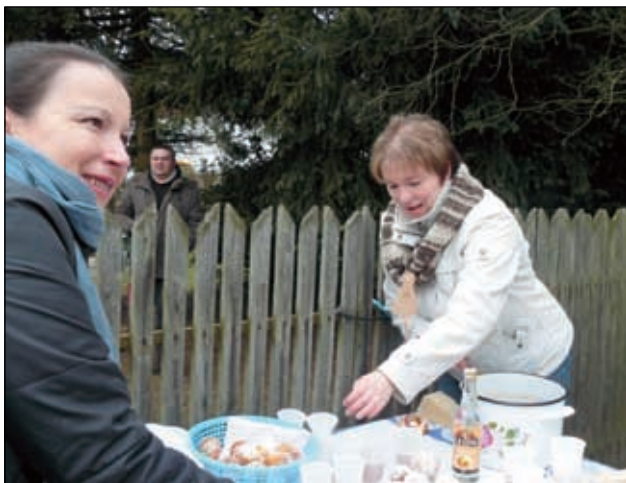
U Moravců ve Lhotě pod Pannou.

Posílení jídlem a pitím se vydáváme na nejdelší tradičně pěší cestu do Byňova. Je to kus cesty, ale alespoň mnozí na čerstvém vzduchu vystřízliví a cesta z kopce není tak nároč-