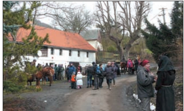
U Kubátů v Byřově.