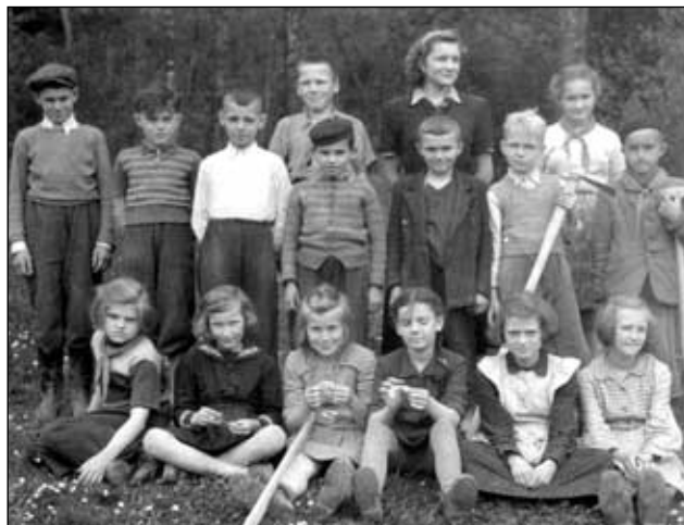
Děti jdou na políčko

Pořádně si je prohlédněte a pátrejte v paměti a zkuste rozpoznat ty, kteří v té době pózovali fotografovi. E.S.