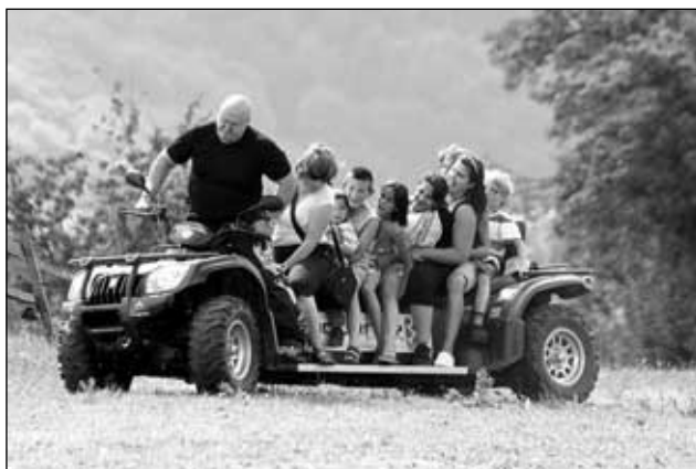
Jízda na jezevčívci

Prošli celou farmou, prohlédly si, jak zde chovaná zvířata