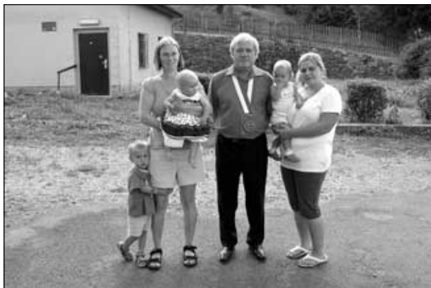
Dva nejmladší občánci

K nahlédnutí zde byla vystavena gratulační kronika, do které se 15ti letí a budoucí prvňáčci podepsali.