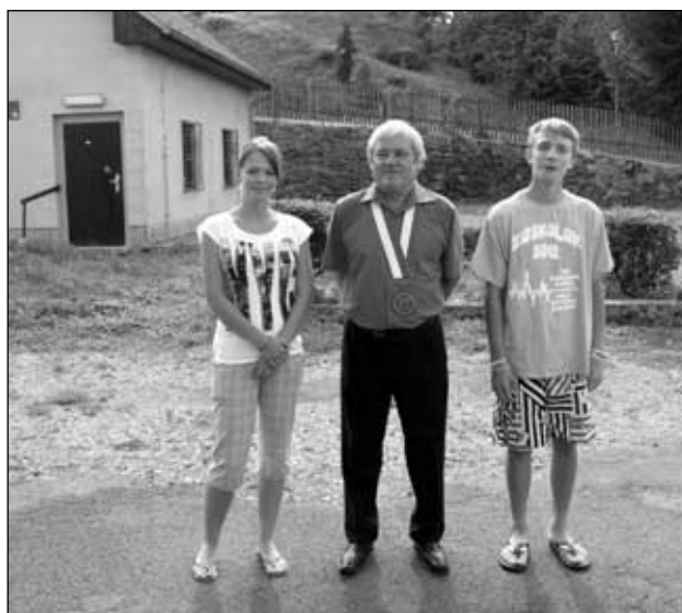
Je nám patnáct let