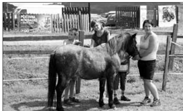
Máme tě rádi koníku

Doufám, že takových akcí bude přibývat a umožníme dětem z města poznat to, co my považujeme za samozřejmost. Život na vesnici. E.S.