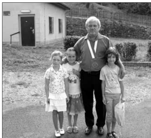
My jdeme do školy

Po příjemné půl hodině se hosté odebrali ke svým domovům.