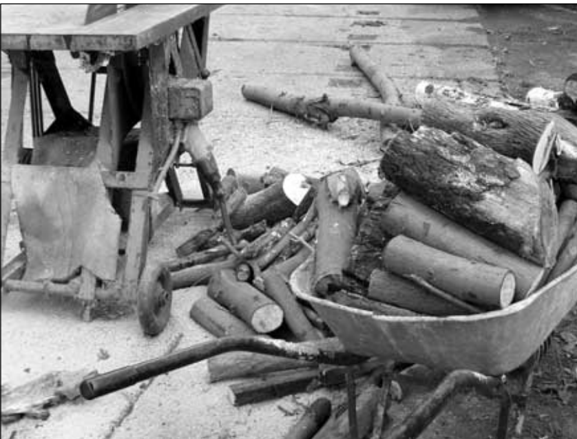
Dřevo na zimu.

K ončící září a ta doba nás popohání ke sklizení ovoce a zeleniny z našich zahrádek a sadů, které pomalu osiří. Tu a tam už zahlédneme zorané poličko a často pak i barevné listí tančící okolo stromů poháněné podzimním větrem, než s konečnou platností dopadne na zem, kde bude zmáčeno deštěm a později snad i sněhem.