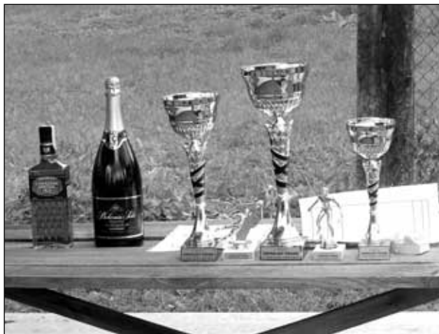
Ocenění pro nejlepšího...

Počasí nám přálo. Sluníčko svítilo již od rána, a proto rozhodčímu, panu P.Lutkovi, nic nebránilo odpískat začátek prvního zápasu.